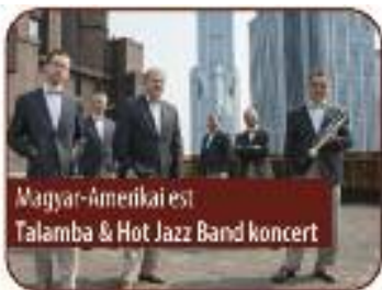
Magyar-Amerikai est Talamba & Hot Jazz Band koncert