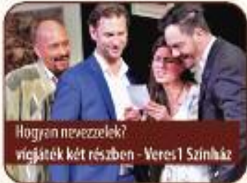
Hogyan nevezzetek? vígjáték két részben - Veres I Színház