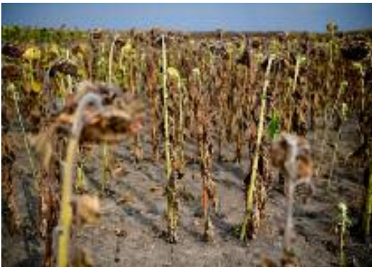
Aszály nyár végén

gődik egy Mandulabarack fa. Néhány évig hozta a csodálatos termést, de a jégeső beadott neki: konzekvensen keveset kínál azóta, a levelek kb. 30 %-kal kisebbek (meg is mértem) lettek és csak halványzöldek.