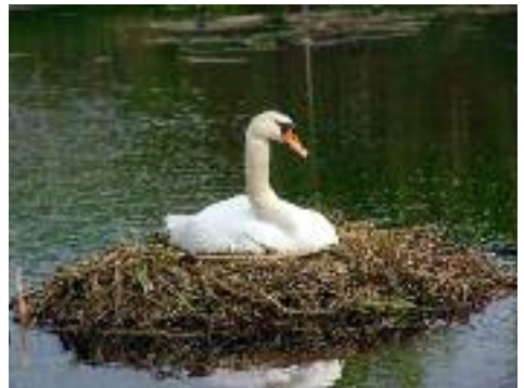
A tojó üli a tojásokat

Az ivarérettséget 2-3 éves korban éri el, monogámok. A hattyú párok násza a téli hónapokra esik. Ilyenkor szorosan egymás mellett úsznak, és azonos ütemben mozgatják nyakukat. A fejüket oldalra hajtják, meghajolnak, és a vízbe mártják csőrüket, nemritkán a partner nyakát átkulcsolva.