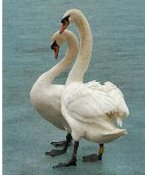
Hattyú-nász egy pillanata

Hosszas, csapkodó vízfelszíni nekifutással emelkedik fel, de ha már a levegőben van, kitartóan repül. Repüléskor evezőtollai messziről hallható füttyülő hangot adnak. Akár a többi réceféle, vedléskor egyszerre veszíti el összes evezőtollát, és ilyenkor átmenetileg röpképtelenné válik. Fogságban